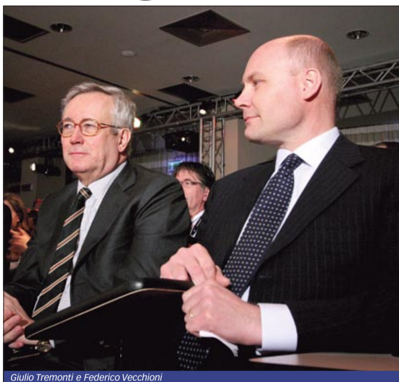
Giulio Tremonti e Federico Vecchioni

Per questo c'è bisogno di un rilancio delle produzioni, di regole comuni e di strumenti per gestire il mercato, che non possono andare né nella direzione del protezionismo, né in quella di una liberalizzazione sfrenata degli scambi, che causerebbe squilibri devastanti, soprattutto a scapito dei Paesi in via di sviluppo. La necessità di nuove regole è dettata anche da quanto successo di recente: sembra ormai passata la crisi delle materie prime alimentari che ha alimentato tra il 2007 ed il 2008 una spirale di prezzi al rialzo; le quotazioni sono scese e per gli operatori del settore è rimasta la chiara sensazione che la stabilità dei mercati sia solo un ricordo. Basta una serie di eventi collegati l'un l'altro per ridurre le produzioni ed alzare i prezzi; o, viceversa, per aumentare gli stock e innescare un'ondata ribassista. Inutile dire che a risentire di questa instabilità sono innanzitutto i redditi degli agricoltori.