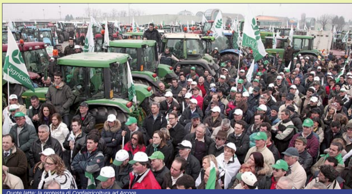
Quote latte: la protesta di Confagricoltura ad Arcore

Con il Consiglio dei ministri europeo dello scorso novembre veniva assegnato un aumento di plafond all'Italia del 5% pari a circa 500.000 tonnellate di latte, risolvendo con anticipo una delle più grosse ingiustizie generate a livello europeo. Il ministro emanava nei primi giorni di gennaio un decreto che riservava ai soli "splaforatori" questo incremento di quota nazionale, dimenticando di fatto tutti coloro che nel