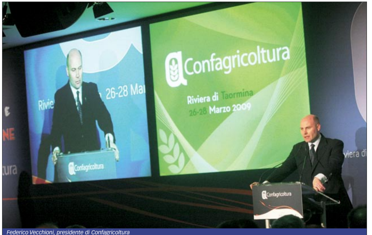
Federico Vecchioni, presidente di Confagricoltura

Numerosi anche in questa edizione gli ospiti intervenuti all'appuntamento: tra questi, il ministro del Lavoro e delle Politiche sociali Maurizio Sacconi, il sottosegretario allo Sviluppo economico Adolfo Urso, il presidente dell'Udc Pierferdinando Casini, il vicepresidente della Commissione agricoltura del Senato Paolo de Castro. Ospite speciale il premio Nobel Rita Levi Montalcini, che ha portato un messaggio rassicurante sull'impiego degli Ogm: "Averne paura - ha detto - è superstizione". Particolare interesse ha suscitato la relazione del-